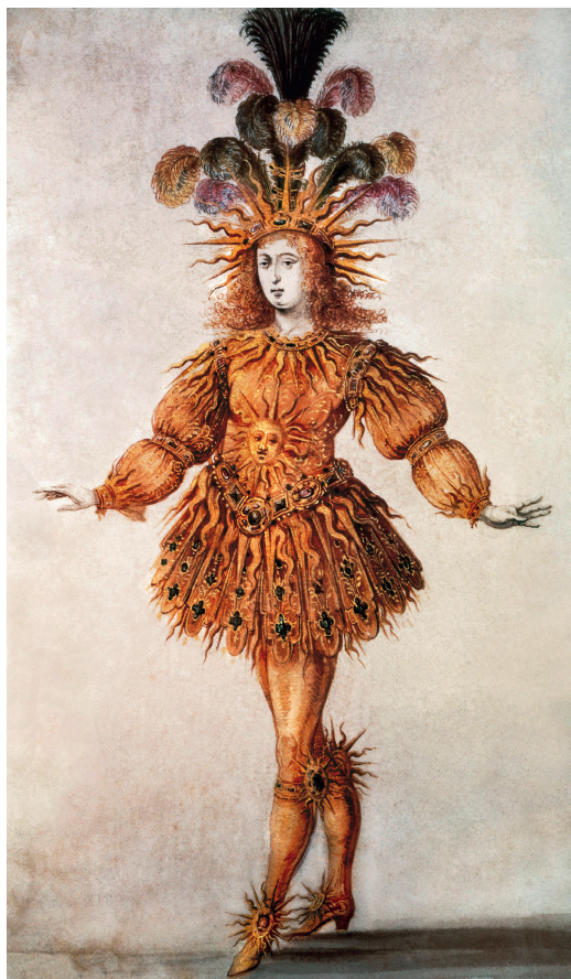
Document 1 • Louis XIV déguisé en soleil, dans le « Ballet royal de la nuit »