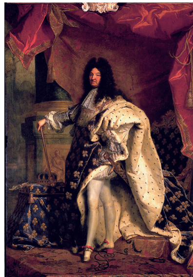
Document 4 • Louis XIV, roi de France, 1701