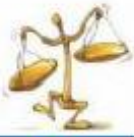
Tableau de conversions Mesures de capacités et de volumes

- les poissons des aquariums A, C et D vient dans l'aquarium de 284 L. - les poissons des aquariums B et E vient dans l'aquarium de 372 L.