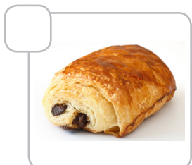
Pain au chocolat